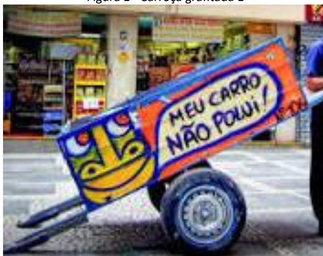
Figura 1 - Carroça grafitada 1

A educação é considerada estética quando se torna um ato criador, quando auxilia os participantes a sentir e compreender o mundo. Não é somente uma arte à qual contemplamos – é, ao mesmo tempo, a vida de cada um de nós, já que a sentimos e a reproduzimos, segundo Berkenbrock-Rosito (2017). A seguir, apresentamos, na Figura 1, uma carroça grafitada. A Figura 2 mostra outra dessas carroças que receberam uma pintura artista. Na Figura 3, aparece um carrinho grafitado. Já a Figura 4 exibe a arte de uma placa para carroça; e a Figura 5 expõe outra carroça grafitada.