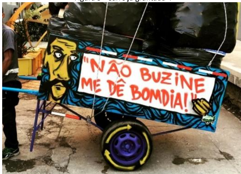
Figura 5 - Carroça grafitada 4