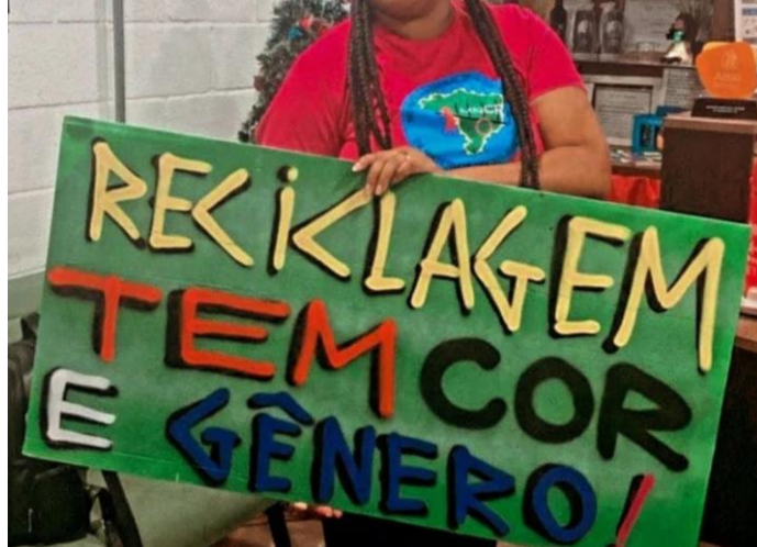
Figura 4 - Placa para a carroça