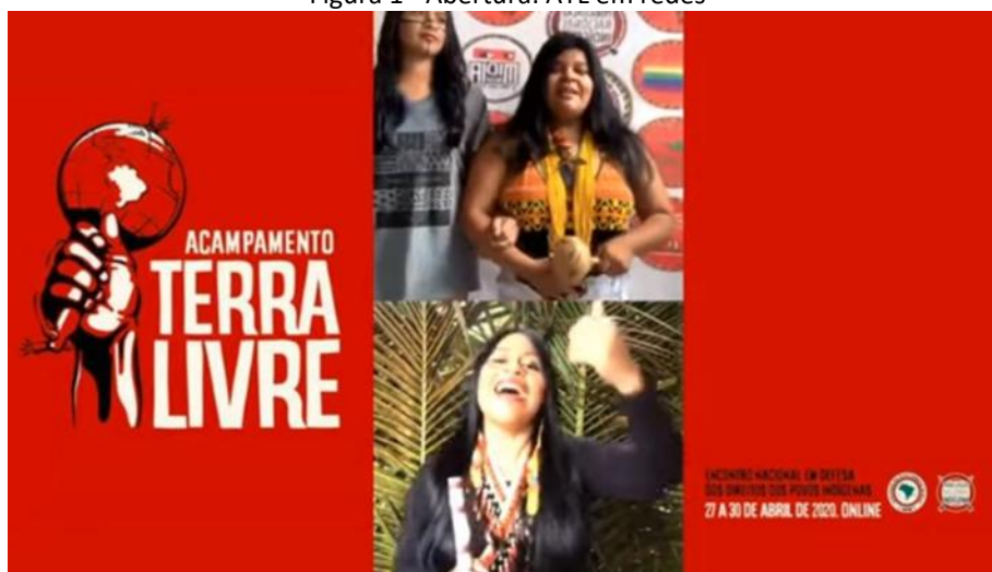
A cada novo ataque uma nova estratégia de LUTA (APIB, 2020a).