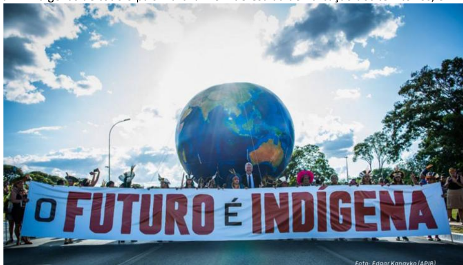
Figura 2 - Indígenas de todo o país marcham em defesa da demarcação dos territórios, em Brasília

Povos Indígenas unidos, movimento e luta fortalecidos (Articulação dos Povos Indígenas do Brasil, 2022b).